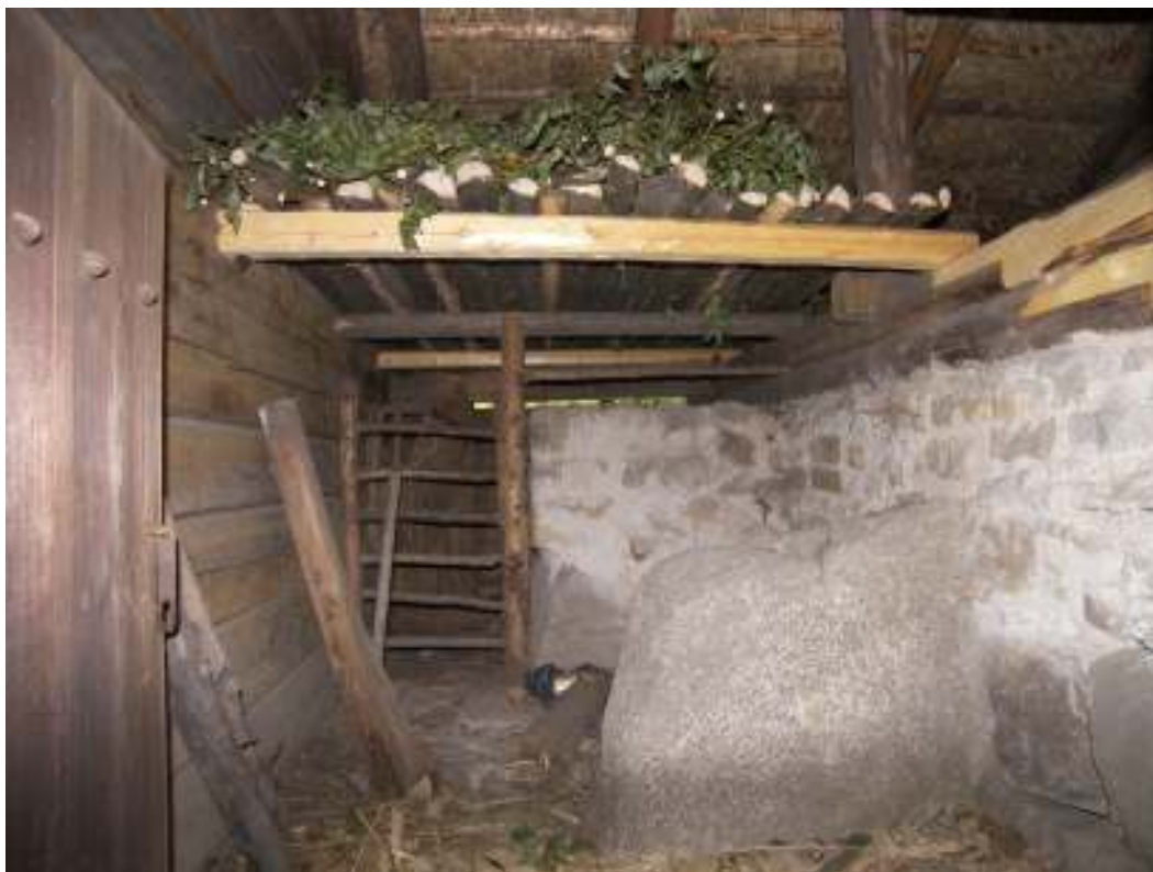
Innertaket över fähuset. Löst liggande räften av barkad och kluven gran har lagts på tre befintliga tvärgående bjälkar. På innertaket har foder av lövruskor lagts upp, i enlighet med beskrivningen i brev till Arthur Hazelius.