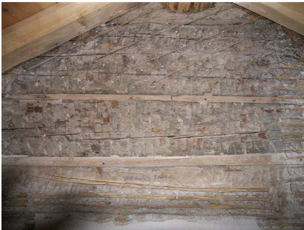
Foto av de tre originalstockarna, där timrets yta har bearbetats med yxa för att få putsen att fästa.