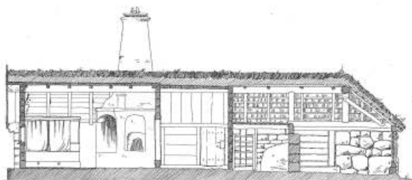
SEKTION I - C-D