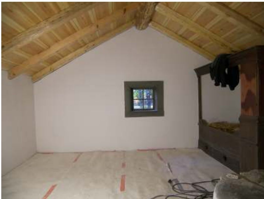
Väggarna har lagats i och avfärgats med limfärg.