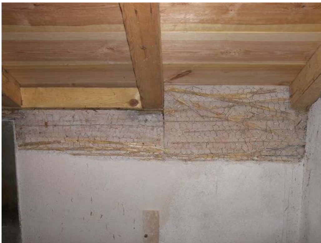
1969 slogs ett ca 2 cm tjockt putslager på väggen. Putsen är fäst på hönsnät med invävd vass.