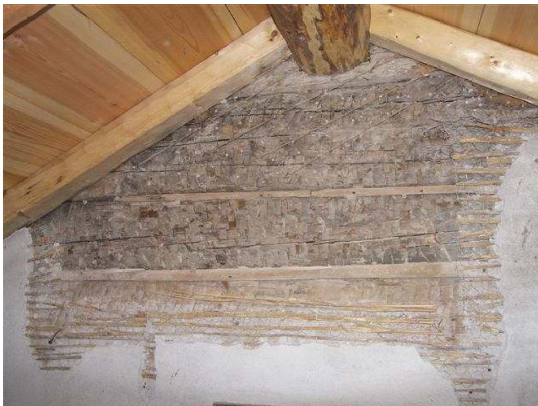
Foto av de tre originalstockarna, där timrets yta har bearbetats med yxa för att få putsen att fästa.