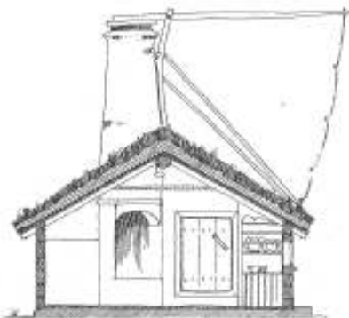
SEKTION I - A-D