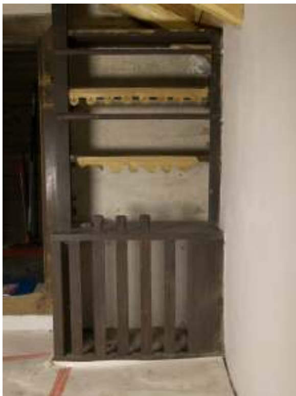
Hyllan där originalputsens från 1898 finns bevarad.