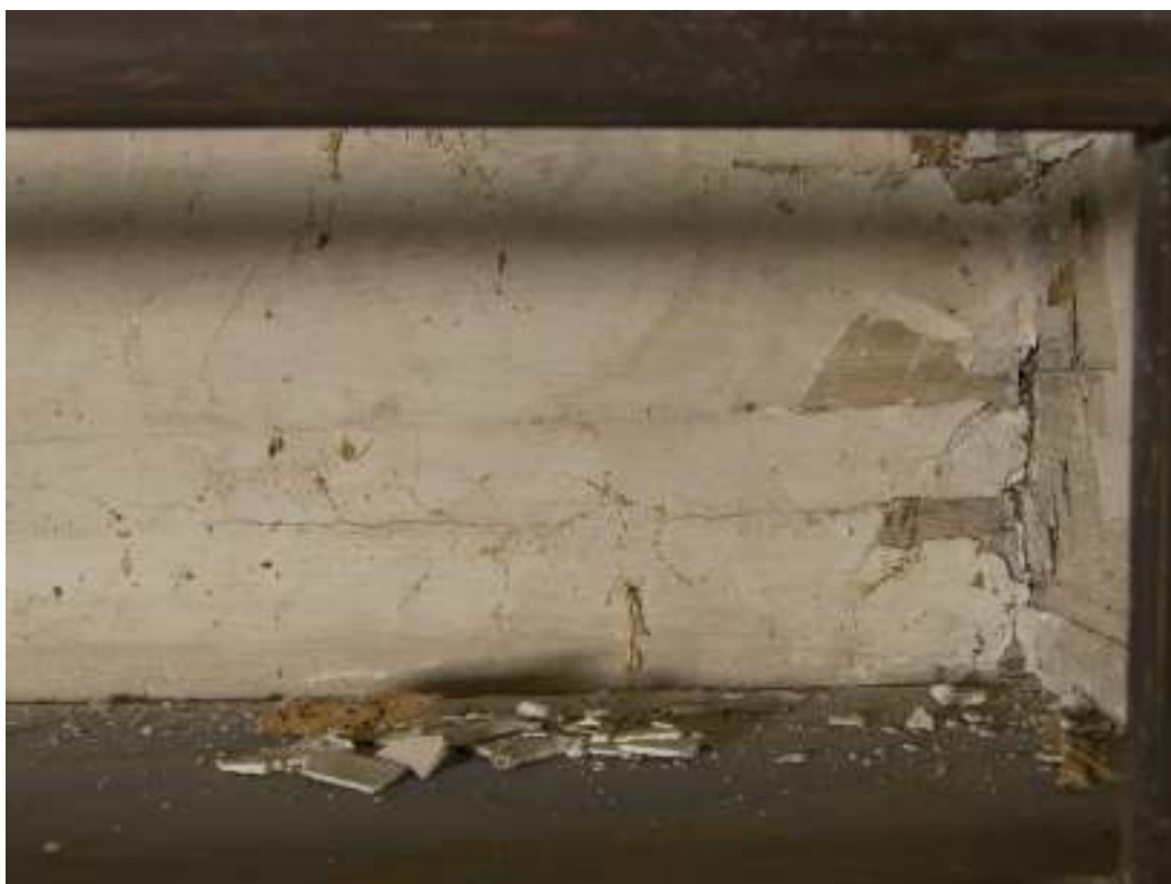
Detalj av originalputs, slagen direkt på putsen i ett varierande tjockt lager (1-3 mm).